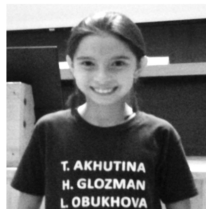
Фото 10. На международных курсах по психологии в Мехико, 2014

В 2014 году состоялись Международные курсы по психологии в городе Мехико. Обставлены они были очень пышно. Пригласили трех человек: Ахутину, Обухову и меня. Мы читали лекции в течение нескольких дней. И нас встречали девочки в маечках, на которых были наши имена (фото 10). Это было очень трогательно.