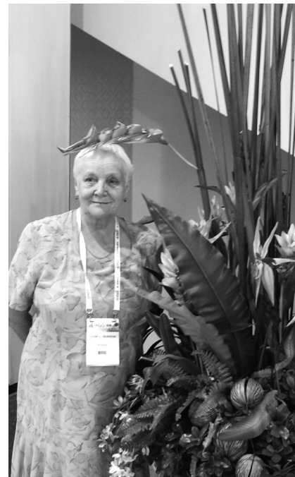
Фото 13. I Международный конгресс по детской психологии в Браге, Португалия, 2015

Затем в 2015 году состоялся I Международный конгресс по детской психологии в Браге (Португалия), где Людмила Филипповна сделала доклад по детским рисункам (фото 13).