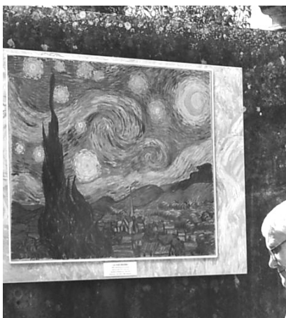
Фото 8. Прованс (Франция), 2013

Через год мы вместе поехали в Прованс, в места, где жили и работали импрессионисты, в маленькие французские городки (фото 8).