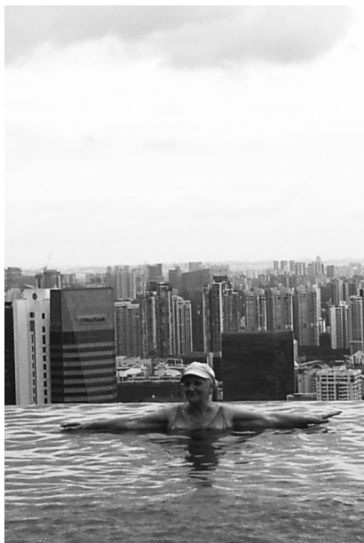
Фото 12. Над Сингапуром

Новый 2015 год мы встретили в Сингапуре. Людмила Филипповна плавала в знаменитом бассейне, который находится на 40-м этаже здания (фото 12). Причем, обратите внимание, что в бассейне нет никаких бортиков. Действительно, кажется, что плаваешь над городом. Это было замечательно.