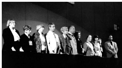
Фото 1. Пуэбла (Мексика), 2002 Photo 1. Puebla (Mexico), 2002

доктор психологических наук, профессор, ведущий научный сотрудник лаборатории нейропсихологии факультета психологии МГУ имени М.В. Ломоносова, научный руководитель Научно-исследовательского центра детской нейропсихологии имени А.Р. Лурия E-mail: glozman@mail.ru psy.msu.ru/people/glozman.html