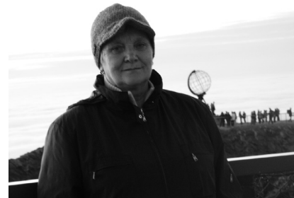
Фото 3. Нордкап (Норвегия), 2009 Photo 3. Nordkapp (Norway), 2009

зать, восторженно воспринимала. Любимое ее выражение, которое она повторяла очень часто, увидев что-то красивое и интересное «Я в раю!» Ее все интересовало, поэтому мы с ней много ходили и смотрели. Короткого путешествия по голубому Рейну нам оказалось мало, и мы отправились в Норвегию: на о. Шпицберген и на мыс Нордкап на о. Магерё (фото 3 и 4).