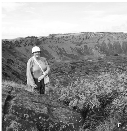
Фото 11. Путешествие по Южной Америке, 2014