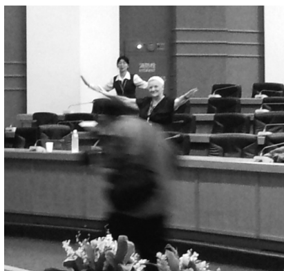
Фото 15. V Международная конференция по проблемам физической активности, Тайвань, 2015 Photo 15. 5th International Conference on Physical Activity, Taiwan, 2015