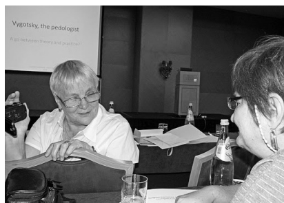
Фото 5. Международная конференция памяти Выготского, Португалия, 2010

были и заседания, и путешествие в красивые уголки Португалии (фото 5).