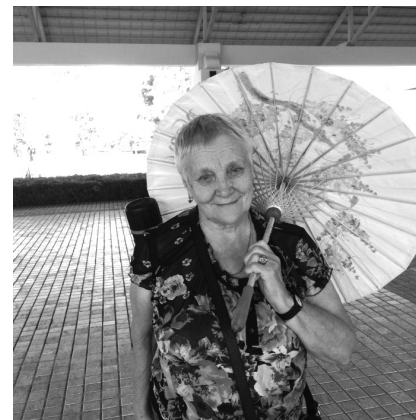
Фото 9. XX Международный конгресс по геронтологии в Сеуле, 2013

В 2013 году состоялся XX Международный конгресс по геронтологии в Сеуле. Первая вещь, которую она купила себе, – вот этот зонтик, который ей очень понравился, и она с ним потом не расставалась (фото 9).