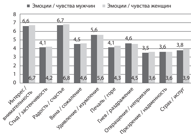
Рис. 1. Средние значения выраженности базовых эмоций и чувств в группах мужчин и женщин, состоящих в близких отношениях (n = 90)

Далее нами проанализированы эмоциональные состояния, свойственные партнерам в близких отношениях с точки зрения половых различий. Средние значения для каждого из них представлены на рис. 1: